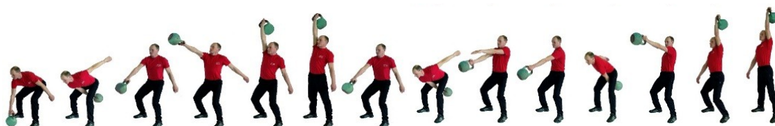
Рис. 4. Рывок гири

При нарушении условий выполнения упражнения повторение не засчитывается, подается команда «НЕ СЧИТАТЬ».