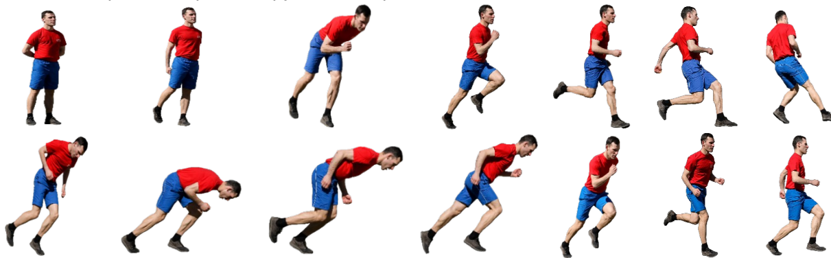
Рис. 6. Челночный бег 10×10 м

При нарушении условий выполнения упражнения предоставляется вторая попытка, при повторном нарушении норматив считается невыполненным.