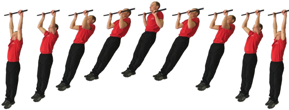
Рис. 1. Подтягивание на перекладине