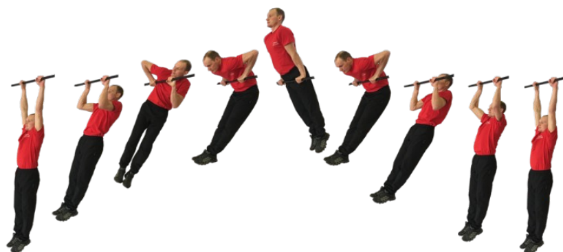
Рис. 3. Подъем силой на перекладине