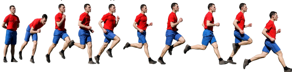
Рис. 7. Бег на 1 км, бег на 3 км.

Старт и финиш, как правило, оборудуются в одном месте. При выполнении упражнений на беговой дорожке стадиона старт и финиш производится в соответствии с разметкой стадиона.