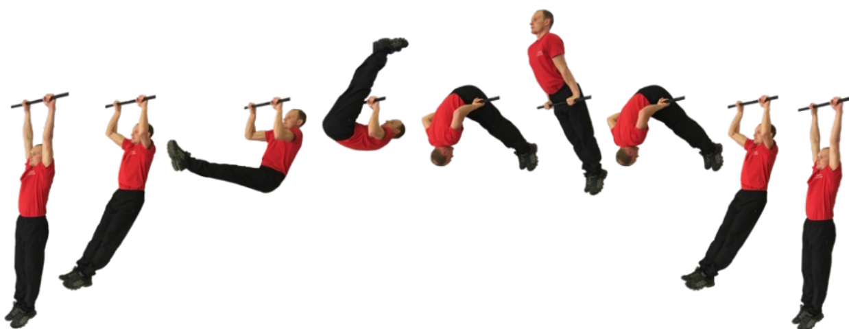
Рис. 2. Подъем переворотом на перекладине